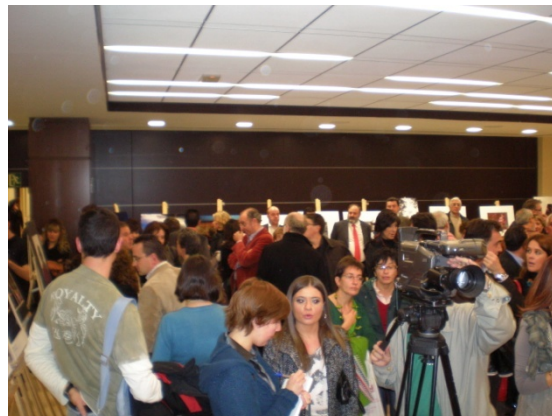
PUBLICO ASISTENTE A LA ENTREGA DE PREMIOS