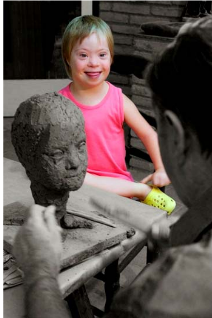
“LA PEQUEÑA MODELO” de María Teresa Cusach Colomer