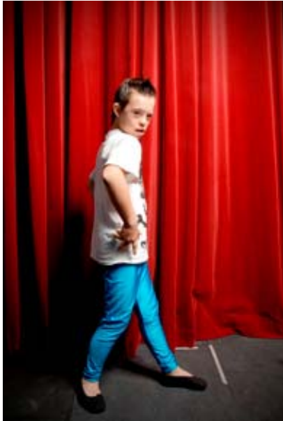
FLICK FLOCK DANZA (3) de Daniel Méndez